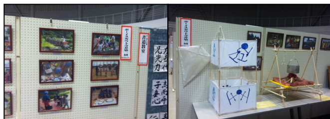
寺井第一団さん展示ブース