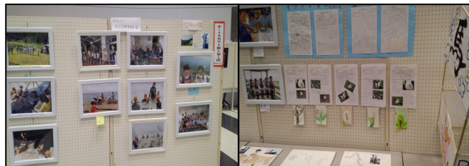
根上第一団さん展示ブース

たくさんの活動写真、凧揚げ大会に使用した手作り凧、立ち釜戸の模型、体験日誌などが展示され、来場された市民のみなさんにはスカウト活動について理解を深めていただけたようでした。